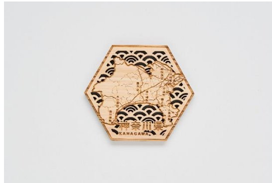
ヒノキシリーズ コースター 神奈川県 商品イメージ