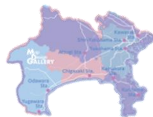
＜横浜赤レンガ倉庫店限定 ノベルティステッカーイメージ＞

ゼンリンとは、地図情報の調査・制作・販売を行う企業です。ゼンリンでは、地図という身近で便利な「ツール」を「柄・デザイン」として捉え、保有している日本全国の詳細な地図データや所蔵している西洋製の日本古地図をデザインの題材とした文具や雑貨を、多数企画・販売しています。「Map Design GALLERY」は、“地図に親しむ空間”をコンセプトに、地図柄アイテムを販売するゼンリン直営の専門店として、九州を中心に店舗展開しています。