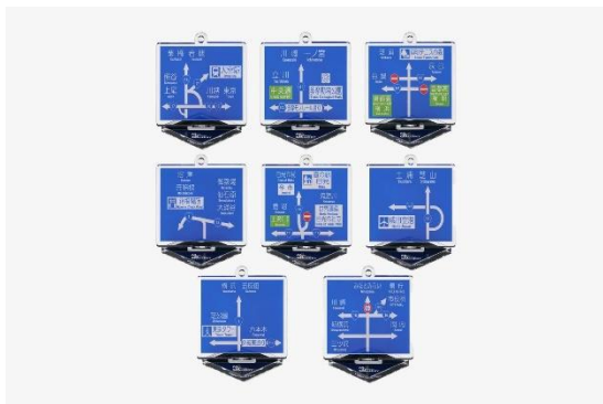
方面看板アクリルキーホルダー カプセルトイ 全8種 商品イメージ

ゼンリンが独自で収集した方面案内看板をアクリルスタンドキーホルダーにした人気シリーズ。今回は、関東エリアの観光地や各地を象徴する場所（ピクトグラム）を厳選してご用意。 本POP-UP STOREの先行販売となります。 今後、Map Design GALLERYオンラインストアでも取り扱う予定です。