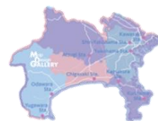
横浜赤レンガ倉庫店限定 ステッカーイメージ