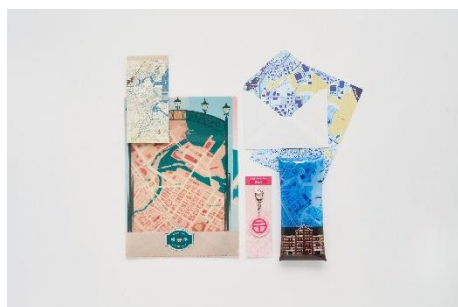
横浜赤レンガ倉庫限定セット（左から）昼、夜 商品イメージ