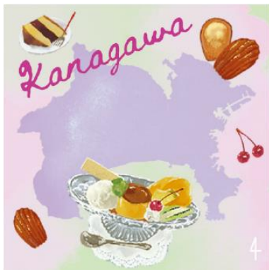
神奈川県×名物（プリンアラモード、マドレーヌ、シベリア） デザインイメージ

旅の思い出が詰まった、お土産にも最適な3種1セットのマグネットシリーズです。それぞれ名物や観光地、交通手段を掛け合わせてデザイン。美濃焼きの技法により、地図やイラストの細かなディテールを表現し、油絵のような温もりある立体的な風合いに仕上がっています。 神奈川県エリアをモチーフにしたデザインは、新商品となります。 （※6月中旬以降に販売予定）