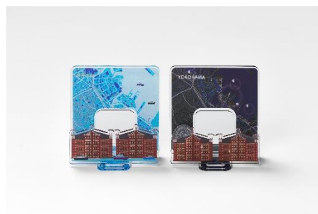
フレーム付きアクリルスタンド（左から）昼、夜 商品イメージ

横浜は昼と夜でそれぞれ違う景色を楽しむことができる魅力的な観光地が多く存在していることから、本商品では、昼と夜のそれぞれの魅力が伝わるように、横浜を象徴する横浜赤レンガ倉庫のデザインをあしらっています。昼は横浜港をイメージしたさわやかな水色、夜は夜景をイメージしたシックな黒とネイビーの色合いでデザインしています。