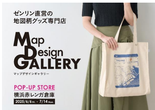
＜「Map Design GALLERY」POP-UP STORE イメージ＞

横浜赤レンガ倉庫では、地図がデザインされた文具・雑貨を販売するゼンリン直営の専門店「Map Design GALLERY」（マップ デザイン ギャラリー）のPOP-UP STOREを、横浜赤レンガ倉庫2号館1階にて、2025年6月6日（金）から7月14日（月）までの期間、展開いたします。