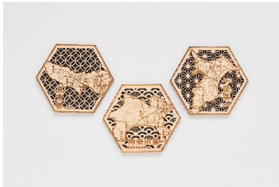
ヒノキシリーズ コースター（左から）東京都、神奈川県、千葉県 商品イメージ

国産のヒノキを使用。良い香りが漂い、日本を感じていただけるシリーズのコースター。ヒノキの木目の美しさと温もりを感じつつ、詳細に刻印された地図を楽しめるデザインになっています。 神奈川県エリアをモチーフにしたデザインは、新商品となります。